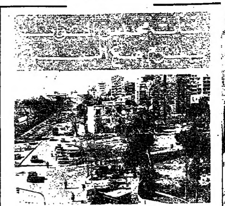
متر الامن العام القديم حيث سيبدأ مبنى مجلس النواب

التعاونيات وتستألف الحلقة عدداً من المحاضرات التي تركز على التعاونيات السكنية في برلين وبيروت. ويشارك في الحلقة المهندس الألماني وينتركارسكي، وهو من كبار خبراء التعاونيات السكنية في ألمانيا، والشرط المسبق لانشاء التعاونيات.